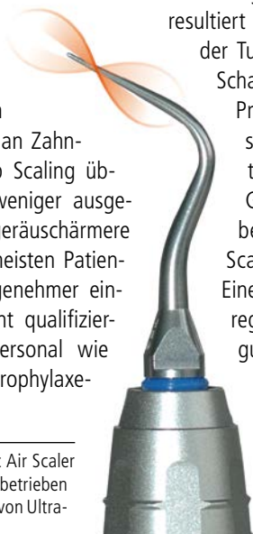
Abb. 3: Der neue Ultrasonic Air Scaler von Cumdente ist druckluftbetrieben und bietet dabei alle Vorteile von Ultraschallschwingern.